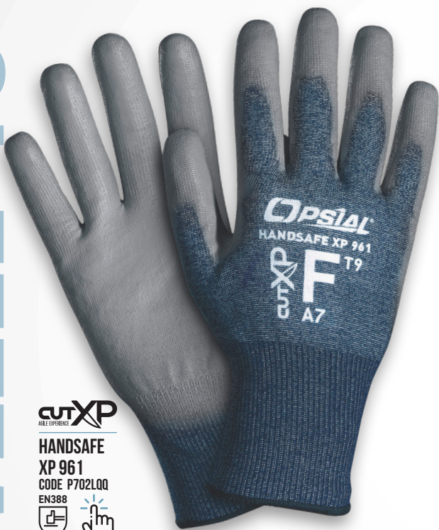
CUTXP AGILE EXPERIENCE HANDSAFE XP 961 CODE P702LQQ EN388 4.X.4.3.F